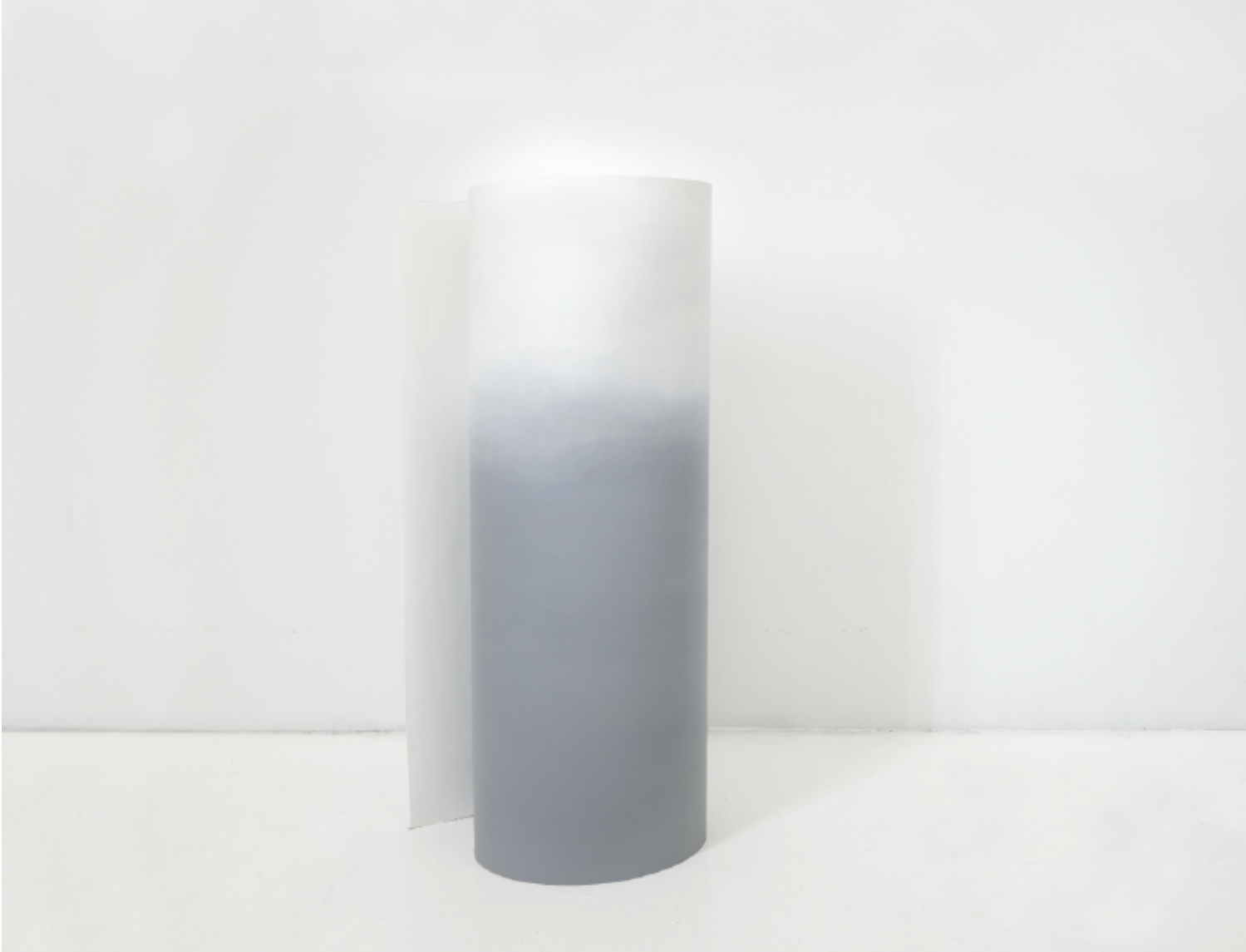
Título / Title: Contraccion Ultima Luz . Contraction from Last Light Técnica / Technique: Sculpture painting on paper 300 gsm Dimensiones / Dimensions: 106 cm x 25 cm aprx. Año / Year: 2017