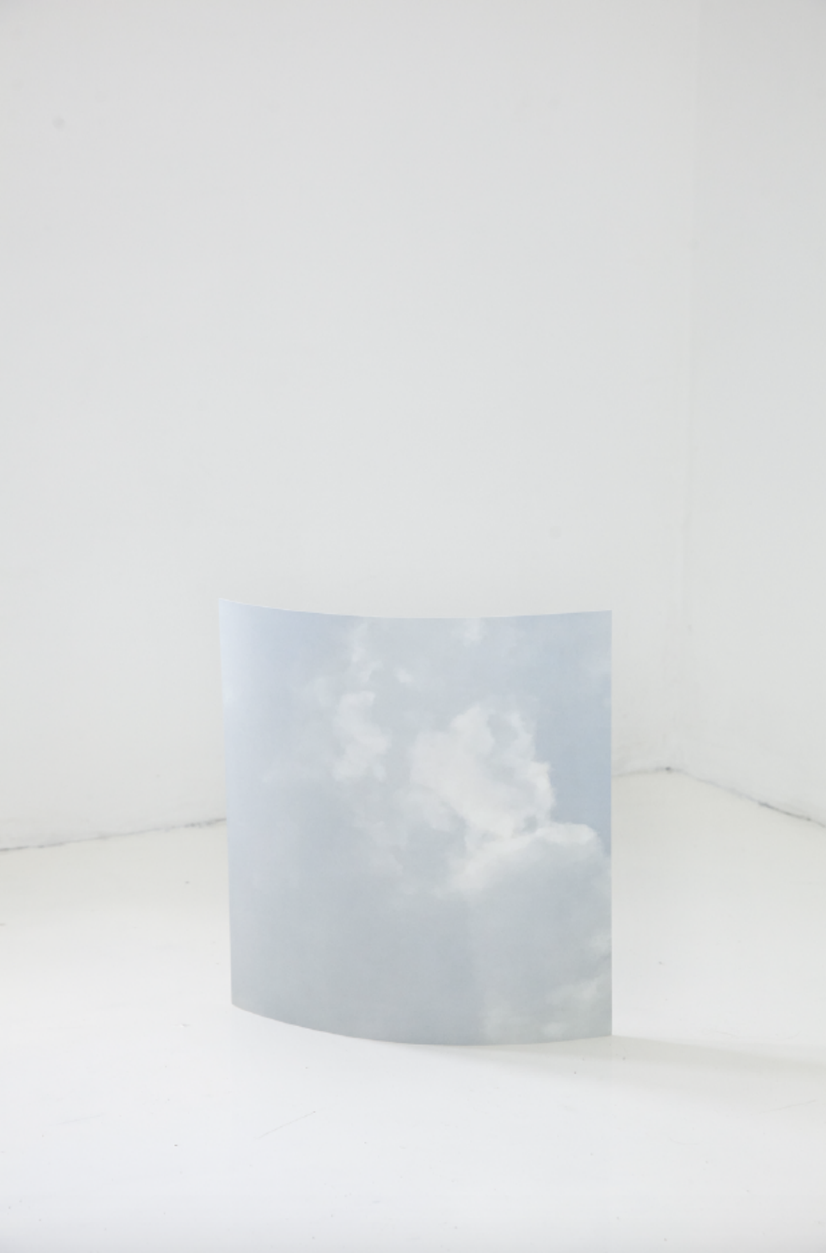
Título / Title: Sin titulo de Medio. Untitled from Medio Técnica / Technique: Fotografía en papel de algodón 300 gsm Cotton paper photography 300 gsm Dimensiones / Dimensions: 40 x 40 cm Año / Year: 2016