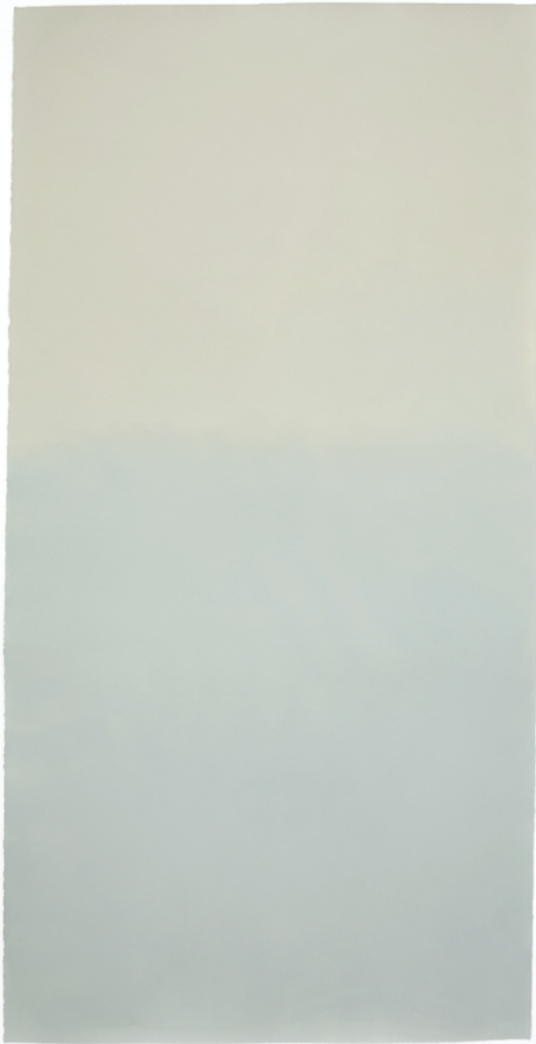
Título / Title: Sin titulo de Ultima Luz . Untitled from Last Light Técnica / Technique: Sculpture painting on paper 300 gsm Dimensiones / Dimensions: 225 x 115 cm Año / Year: 2017